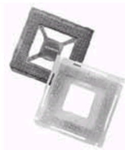
图 2: 两件套 BGA 插座适配器系统给大量生产的 BGA 封装接插提供了经济实用的方案。

带共晶焊球的插座或适配器尺寸近似于器件封装尺寸。如果插座或插座/适配器仅比器件大 1 到 2mm，那么插座可以直接安装到生产电路板上。这样就不再需要专门的 PCB，从而可节省相应的成本，同时生产电路板可直接用于调试，也就省掉了与实际应用相关的附加环节。