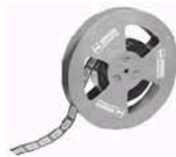
图 3：卷带式封装可实现 BGA 插座在 PCB 上的自动装配。

这种精细间距封装器件采用插座时，必须考虑板上带有镀层的过孔间的布线能力。焊接到板上的管脚直径应该最小化。如果要进行表面安装，可以在焊球焊盘的底部走线。这时插座的共晶焊球又一次变得重要。使用它们，既可以提供小型封装，又可以保持良好的电气特性。如果器件被焊接到能够插入插座的适配器上，那么就很容易拔出。而如果所采用的插座是可表面安装的，那么上述优点便都可以得到。插座/适配器除了要提供与 BGA 器件封装尺寸一致的小型封装外，还必须考虑到其它一些应用特性。插座/适配器或插座必须具有低阻抗。这样对器件来说插座或插座/适配器是透明的。无论是直接安装或通过插座安装到电路板上，器件都应具有相同的性能。在许多应用场合，采用散热器可以增强插座的散热能力，消除器件所产生的热量。许多器件会产生相当大的热量(对 BGA 器件来说 3W 到 5W 并不是很大的热量)。在某些应用中器件所产生的热量可高达 15W 到 20W，这时，除了散热器外风扇也是必需的。