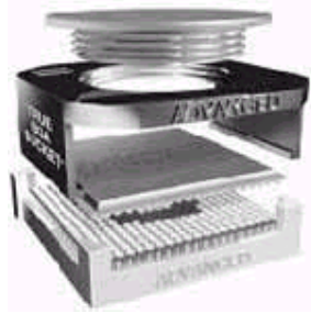
图 5: True BGA Socket 是在 PCB 布线中节省空间的实例。它免去了 BGA 器件的焊接。采用插座和插座/适配器来连接 BGA 器件和电路板是一个很有效的方法,并被广泛应用于亚洲地区。在对存储芯片、微处理器和 FPGA 器件进行设计、仿真、测试甚至生产时,都会采用插座和插座/适配器。